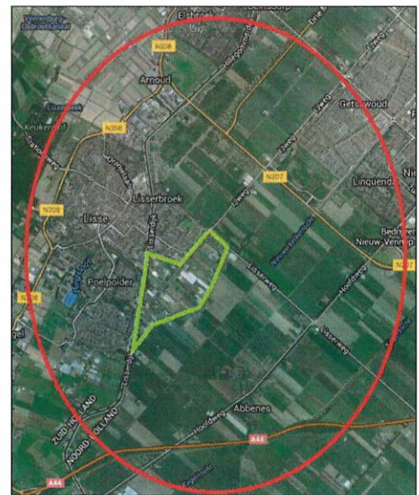
Rood: Globale begrenzing Gebiedskaart Groen: begrenzing 'Lisserbroek binnen Turfspoor'

Dit wordt in beeld gebracht door met elkaar een Gebiedskaart op te stellen. De eerste stap is het in beeld brengen van de bestaande situatie die vastgelegd wordt op een inventarisatie kaart. De volgende stap is het in beeld brengen van vigerend beleid en ontwikkelingen die in en om Lisserbroek spelen (zie de rode cirkel) en of daar knelpunten uit voortvloeien. Tot slot wordt het toekomstperspectief toegevoegd uit onder meer het Ambitiedocument. Dit brengt de opgaven in beeld voor de woningbouwontwikkeling Turfspoor en bestaand Lisserbroek: wat er moet gebeuren.